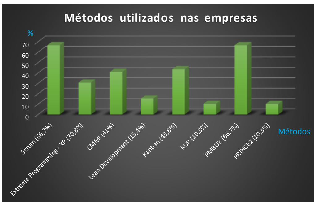
Gráfico 1 – Práticas de gestão de projetos nas empresas

Letelier e Penadés (2006), é a simplicidade, tanto na aprendizagem quanto na aplicação, reduzindo, dessa forma, os custos de implementação em uma equipe de desenvolvimento e por esse motivo levou a um interesse crescente nessas metodologias.