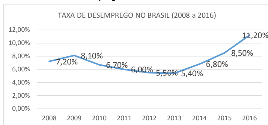
Gráfico 2 – Taxa de desemprego no Brasil entre 2008 e 2016

daí grande elevação, culminando na taxa de 11,2% (2016), onde se constata que a taxa de desemprego mais que dobrou nos últimos 3 anos, conforme ilustra o Gráfico 2.